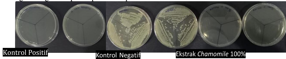
Gambar 1.1 Hasil jumlah koloni bakteri Staphylococcus aureus yang terbentuk pada masing-masing kelompok.

masing kelompok dilakukan menggunakan uji Kruskal Wallis dengan P-value 0,001 ( P < 0,05 ). Perbedaan bermakna jumlah koloni bakteri Staphylococcus aureus diantara masing-masing kelompok, dilakukan menggunakan uji Mann Whitney dengan P-value 0,002 untuk perbandingan jumlah koloni bakteri Staphylococcus aureus pada larutan obat kumur chlorhexidine 0,2% terhadap larutan aquadest , dan P-value 0,003 untuk perbandingan jumlah koloni bakteri Staphylococcus aureus pada larutan ekstrak bunga chamomile 100% terhadap larutan aquadest ( P < 0,05 ), serta P-value 0,317 untuk perbandingan jumlah koloni bakteri Staphylococcus aureus pada larutan obat kumur chlorhexidine 0,2% terhadap larutan ekstrak bunga chamomile 100%. Hasil jumlah koloni bakteri Staphylococcus aureus yang terbentuk pada masing-masing kelompok dapat dilihat pada Gambar 1.1.