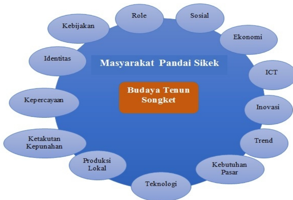
Gambar 3. Budaya tenun songket bagi masyarakat Pandai Sikek pada proses terjadinya transformasi pengetahuan

terjadi pada masyarakat lokal di Pandai Sikek. Walaupun jumlah masyarakat secara kuantitas meningkat, namun jumlah penenun dapat dikatakan menurun. Hal ini yang menjadi ancaman bagi masyarakat sehingga diperlukan pengembangan dan penciptaan pengetahuan baru dalam bentuk teknologi dan inovasi. Desakan kebutuhan pasar dengan jumlah penenun yang berkurang setiap tahunnya mendorong terjadinya proses transformasi pengetahuan.