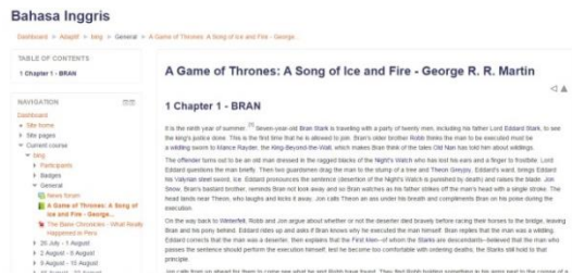
Gambar 6 Course Overview