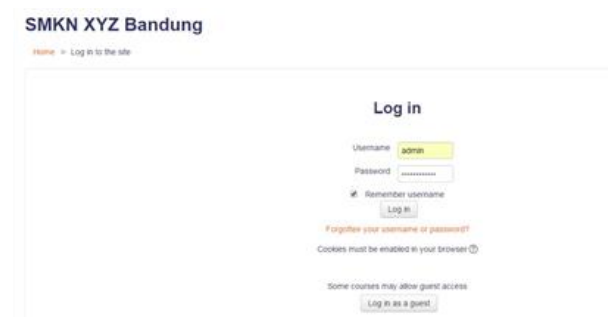
Gambar 5 Halaman Login