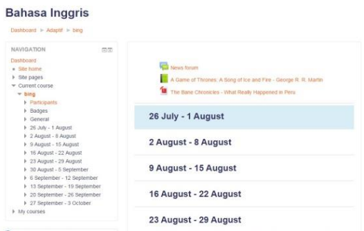
Gambar 7 Contoh tampilan materi online

Di dalam setiap kelas ( course ), tersedia beberapa pilihan fungsi upload file ( file picker ), termasuk di dalamnya fungsi pemberian materi online ( books, files ), fungsi penugasan online ( assignment ), fungsi kuis online ( quiz ), fungsi diskusi online ( forum ) bahkan fungsi chat. Gambar 6 menampilkan contoh tampilan materi yang diupload ke Moodle.