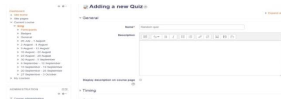
Gambar 8 Online Quiz

Di dalam setiap kelas ( course ), tersedia beberapa pilihan fungsi upload file ( file picker ), termasuk di dalamnya fungsi pemberian materi online ( books, files ), fungsi penugasan online ( assignment ), fungsi kuis online ( quiz ), fungsi diskusi online ( forum ) bahkan fungsi chat. Gambar 6 menampilkan contoh tampilan materi yang diupload ke Moodle.