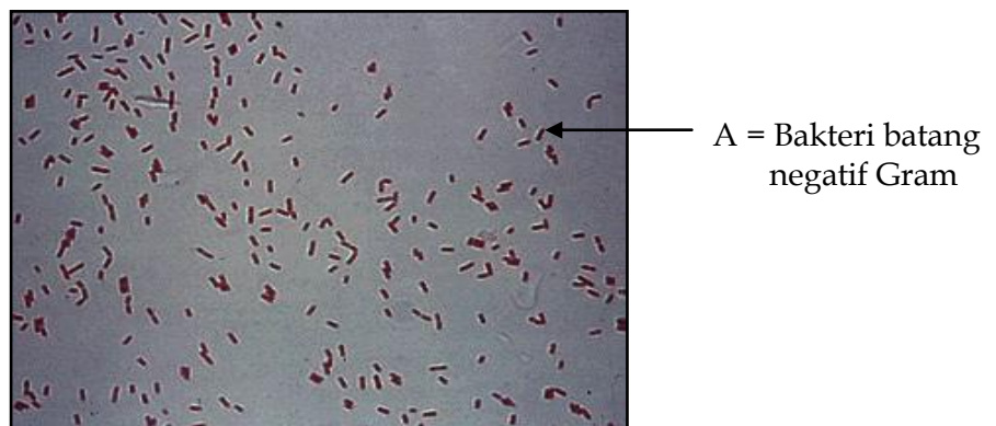
Gambar 2. Hasil Pewarnaan Bakteri negatif Gram Ket.: A = Bakteri batang negatif Gram