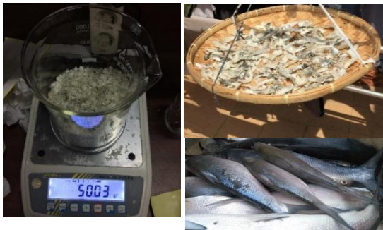
Gambar 1. Proses pengambilan sisik ikan

Hasil pembuatan Chitosan dari ikan bandeng seberat 8kg yang diambil sisik ikan bandeng nya kemudian dijemur dibawah sinar matahari dan dihaluskan menghasilkan sisik ikan bandeng kering seberat 50gr seperti yang terlihat pada Gambar 1 dibawah ini. Kemudian menghasilkan 0,25gr Chitosan seperti yang ditunjukkan gambar 3. Melalui 3 tahapan proses yaitu deproteinasi, demineralisasi, dan deasetilasi (Gambar 2).