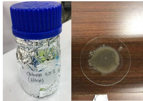
Gambar 3. Hasil Pembuatan Chitosan